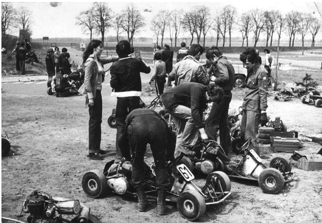
Z archiwum Klubu Gepard. Trening na torze w Rusocinie. Lata sześćdziesiąte XX w.

Prezes zaznacza z naciskiem, że tor w Rusocinie ma służyć nie tylko kartingowi. Będzie też autodromem do szkolenia kierowców oraz uczestników kursów doskonalenia techniki jazdy. Z tą myślą zaprojektowano łączniki pozwalające modyfikować i skracać trasę. W przyszłości można pewnie będzie pomyśleć o oświetleniu obiektu, aby korzystać z niego także po zmroku.